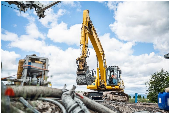
(2) Das eingespielte Team verlegte über 10.000 m Leitungen.